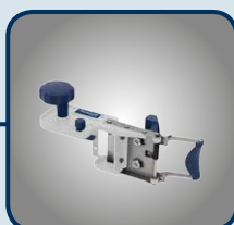
Kantenkappgerät KKG 30