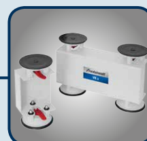
Vakuumklemmset VK 1