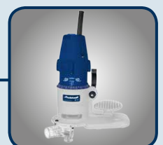
Kantenfräser KF 6