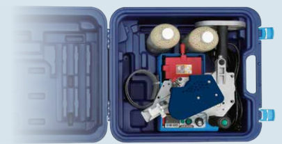
Abb. zeigt Lieferumfang im Kunststoff-Trolley