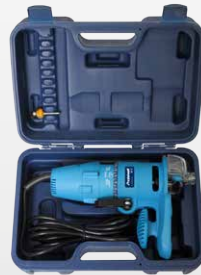
Abb. zeigt Lieferumfang