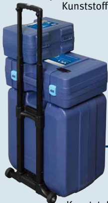
Kunststoffkoffer fixierbar auf Trolley