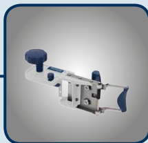
Kantenkappgerät KKG 30